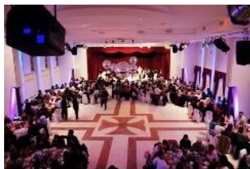
Vista panorámica del salón.