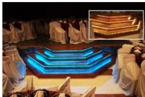
Vista del salón desde el escenario.

“Salón Cedro eventos” ofrece el espacio ideal para la realización de todo tipo de eventos sociales y empresariales. Emplazado en el corazón del microcentro porteño, asegura la presencia de directivos y ejecutivos que pueden acceder fácilmente al lugar disponiendo asimismo de tres plantas de estacionamiento propio para su mayor comodidad.