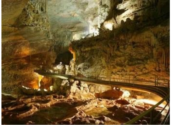
Galerías superiores de la gruta

Ubicada 20 kilómetros al norte de Beirut, en el valle de Nahr al-Kalb, la Gruta de Jeita es una de las más grandes del mundo. Está compuesta por dos cuevas de piedra caliza, galerías en la parte superior y una pequeña cueva a través de la cual cruza el "Río del Perro", o Nahr al-Kalb. En la actualidad, es una de las bellezas naturales nominada para formar parte de las Siete Maravillas del Mundo Natural .