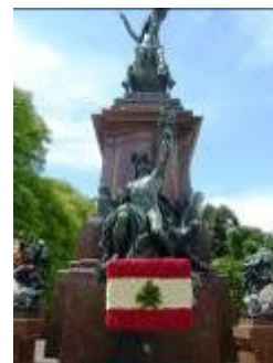
LA BANDERA LIBANESA EN LA PLAZA SAN MARTIN EN LA CAPITAL FEDERAL

Obtenida esta planilla luego se inicia el proceso de ciudadanía libanesa de todos los integrantes de la familia, con la posibilidad de obtener documento de identidad libanesa.