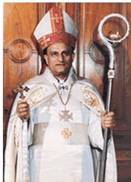
MONSEÑOR CHARBEL MERHI

“CONTINUEMOS SIENDO EN EL LÍBANO Y EN TODO EL MUNDO FAROS POR NUESTRA CONDUCTA Y NUESTRA FIDELIDAD A LA ESPIRITUALIDAD MARONITA QUE CONSISTE PRINCIPALMENTE EN SER TESTIGOS VERDADEROS DE CRISTO”.