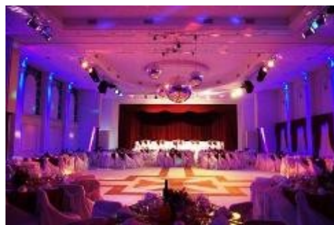
El salón iluminado.