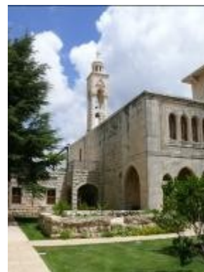
CONVENT DE KFIFAN